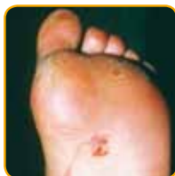
Haakwormen kunnen door de huid heen dringen.